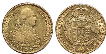
F 1411 2 ESCUDOS . 1807. Madrid AJ. Cal-351. 6,8grs. MBC+ . (Est. 300 €) ..... 200 €