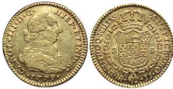
F 1396 2 ESCUDOS . Santa Fe de Nuevo Reino 1779 J.J. 6,7grs. Cal-557. Escasa. MBC+ . (Est. 450 €)..... 250 €