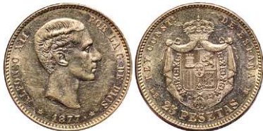
F 1469 25 PESETAS . 1877 *18-77 DEM. Cal-3. 8 grs. Parte del brillo original. EBC. (Est. 260 €)..... 210 €