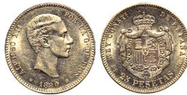
F 1477 25 PESETAS . 1880 *18-80 MSM. Cal-10. 8,1 grs. EBC-. (Est. 260 €)..... 210 €