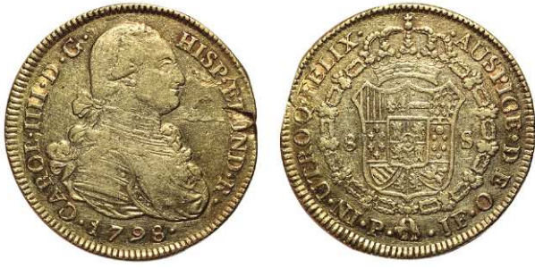
F 1417 8 ESCUDOS . 1798. Popayán J.F. Cal-77. 26,8grs. ( Hoja en anv.) MBC . (Est. 1200 €)..... 800 €