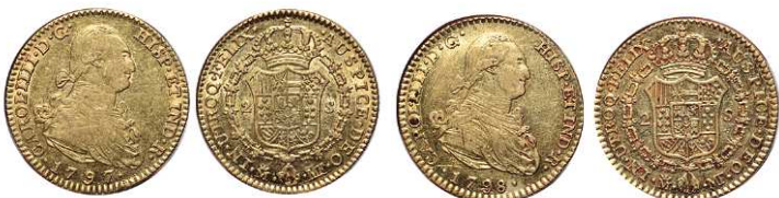
F 1407 2 ESCUDOS . 1797. Madrid MF. Cal-334. 6,7grs. MBC/MBC+ . (Est. 300 €) ..... 200 €