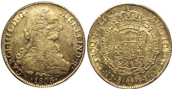
F 1398 8 ESCUDOS . 1803. Santiago FJ. Cal-165. 27grs. (Hoja en anv. y golpecitos en rev.) MBC+ . (Est. 1100 €) ..... 850 €