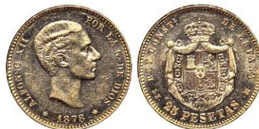
F 1475 25 PESETAS . 1878 *18-78 DEM. Cal-4. 8 grs. (Parte del brillo original con mínimo golpe en la grafila rev. y leves rayitas en anv.) EBC . (Est. 260 €)..... 210 €