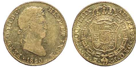
F 1429 4 ESCUDOS . 1820. Madrid G.J. Cal-150. 13,5grs, BC+/EBC- . (Est. 700 €)..... 400 €