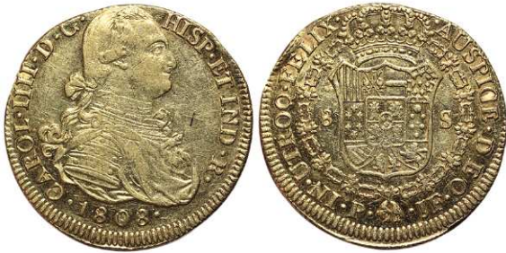
F 1418 8 ESCUDOS . 1808 Popayán J.F. Cal-91. 27grs. ( Golpes en el canto y rayas en anv. Parte del brillo original.) MBC+/EBC- . (Est. 1200 €)..... 800 €