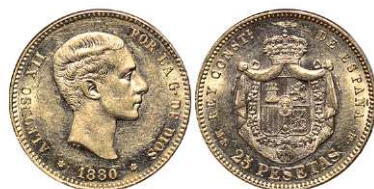
F 1479 25 PESETAS . 1880 *18-80 MSM. Cal-10. 8,1 grs. Parte del brillo original con leves rayitas en el rev. EBC-. (Est. 260 €)..... 210 €