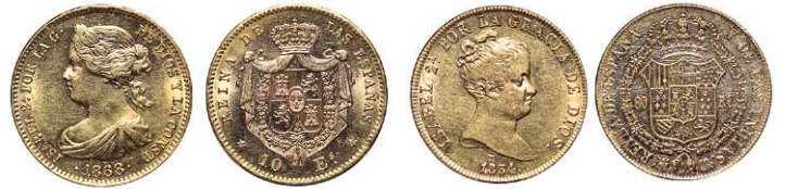
F 1442 10 ESCUDOS . 1868 *18-68. Cal-47. 8,4grs. Parte del brillo original. EBC+. (Est. 360 €)..... 220 €