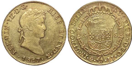
F 1433 8 ESCUDOS . 1817. Mejico J.J. Cal-57. 27,1grs. ¿Ceca rectificada?, parte del brillo original MBC+/EBC- (Est. 1600 €)..... 900 €