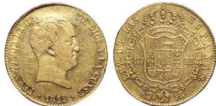
F 1431 160 REALES . 1822. Madrid S.R. Cal-153. 13,5grs, Tipo "Cabezón", Parte del brillo original. (Leve golpe en el canto junto a la ceca) Escasa. EBC- /EBC . (Est. 1600 €)..... 800 €