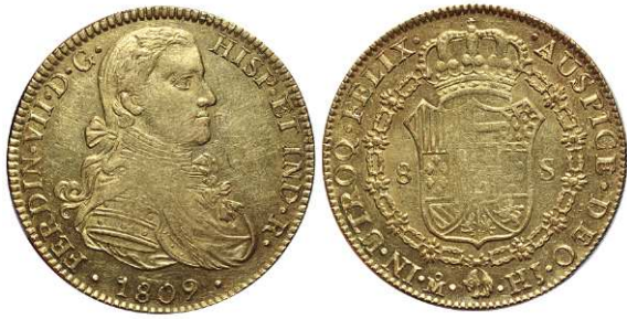
F 1432 8 ESCUDOS . 1809. Mejico H.J. Cal-44. 27grs, Busto imaginario. Parte del brillo original con rayitas de ajuste en rev.. MBC+/EBC- . (Est. 1600 €)..... 900 €