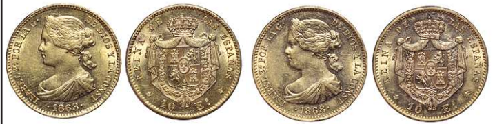
F 1440 10 ESCUDOS . 1868 *18-68. Cal-47. 8,4grs. EBC-/EBC. (Est. 350 €)..... 200 €