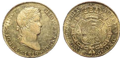
F 1428 4 ESCUDOS . 1819. Madrid G.J. Cal-149. 13,5grs. Parte del brillo original. Escasa así, EBC . (Est. 1200 €)..... 600 €