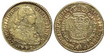
F 1419 2 ESCUDOS . 1792. Santa Fe de Nuevo Reino J.J. Cal-411. 6,8grs. MBC+/MBC. (Est. 350 €)..... 200 €