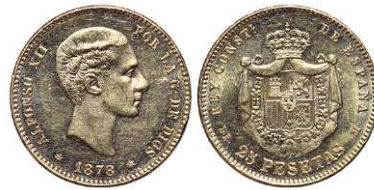
F 1474 25 PESETAS . 1878 * 18-78 DEM. Cal-4. 8grs. Brillo original. EBC+ (Est. 260 €)..... 210 €