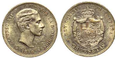
F 1478 25 PESETAS . 1880 *18-80 MSM. Cal-10. 8,1 grs. Parte del brillo original con hojitas en rev. EBC-. (Est. 260 €)..... 210 €