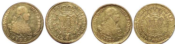
F 1409 2 ESCUDOS . 1800 sobre 1790. Madrid FA. Cal-337. 6,8grs. MBC+ . (Est. 300 €)..... 200 €