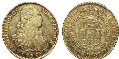
F 1416 4 ESCUDOS . 1796. Madrid M.F. Cal-205. 13,4grs (Parte del brillo original.). EBC . (Est. 750 €)..... 450 €

CONSULTE LOS LOTES CON @ EN NUESTRA WEB: www.subastasevilla.com