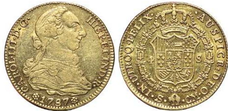
F 1402 4 ESCUDOS . 1787. Sevilla CM. Cal-411. 13,5grs. MBC/MBC+ . (Est. 700 €)..... 400 €