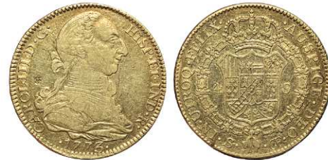
F 1401 4 ESCUDOS . 1773. Sevilla CF. Cal-400. (Contramarca de flor con 4 pétalos, rayas y golpecito en rev.) 13,4grs. Escasa. MBC+/EBC . (Est. 800 €)..... 400 €