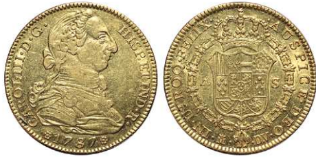
F 1394 4 ESCUDOS . 1787. Madrid DV. Cal-313. 13,5grs (Golpecitos y leves restos de brillo en rev.) MBC+. (Est. 700 €)..... 400 €