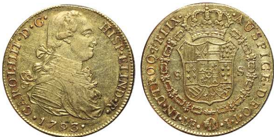
F 1404 8 ESCUDOS . 1793. Lima I.J.. Cal-10. 27,1grs. ( Hoja en anv.) MBC+/EBC- . (Est. 1200 €)..... 800 €