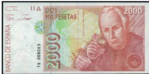
F 1568 2000 PESETAS. 24 de Abril de 1992. Serie 1S. E.E8c. SC . (Est. 45 €)..... 20 €