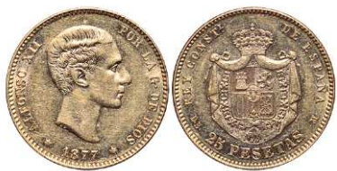
F 1472 25 PESETAS . 1877 *18-77 DEM. Cal-3. 8,1 grs. EBC-. (Est. 260 €)..... 210 €