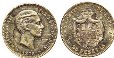
F 1473 25 PESETAS . 1878 *18-78 DEM. Cal-4. 8 grs. (Rayas en Anv. y Rev. con parte del brillo original) MBC+ . (Est. 260 €)..... 210 €