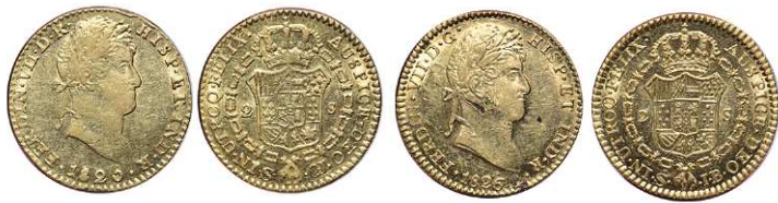
F 1434 2 ESCUDOS . 1826. Sevilla G.J. Cal-262. 6,8grs (Golpe en el canto) MBC- . (Est. 300 €)..... 200 €