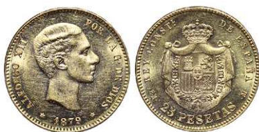
F 1476 25 PESETAS . 1879 *18-79 EMM. Cal-9. 8 grs. Parte del brillo original EBC+ . (Est. 260 €)..... 210 €