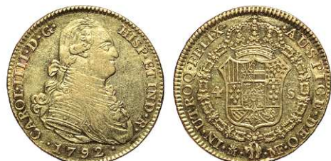
F 1414 4 ESCUDOS . 1792. Madrid M.F. Cal-202. 13,4grs (Parte del brillo original en rev.). MBC+/EBC . (Est. 750 €)..... 450 €