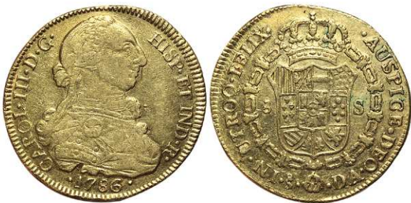
F 1397 8 ESCUDOS . 1786. Santiago DA. Cal-246. 26,9grs. MBC . (Est. 1100 €)..... 850 €