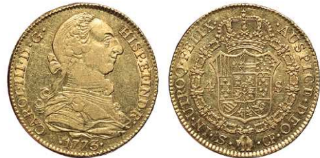
F 1400 4 ESCUDOS . 1773. Sevilla CF. Cal-400. 13,4grs. Escasa. MBC+/EBC . (Est. 800 €)..... 500 €