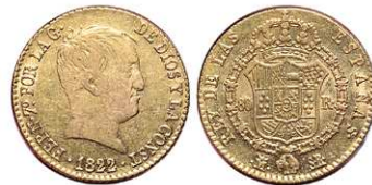
F 1430 80 REALES . 1822. Madrid S.R. Cal-218. 6,7grs. Tipo "cabezón" MBC/EBC- . (Est. 350 €)..... 200 €