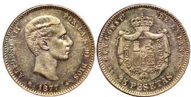
F 1470 25 PESETAS . 1877 *18-77 DEM. Cal-3. 8,1 grs. Parte del brillo origina con leve hojita en revl. EBC. (Est. 260 €)..... 210 €