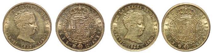
F 1446 80 REALES . 1843. Madrid C.L. Cal-76. 6,8grs. MBC . (Est. 320 €)..... 200 €