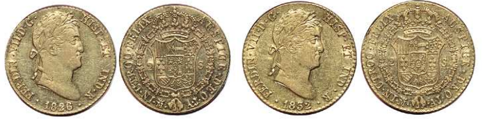
F 1426 2 ESCUDOS . 1826. Madrid A.J. Cal-223. 6,8grs. MBC . (Est. 350 €)..... 200 €