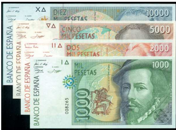
F 1569 SERIE COMPLETA de 1000 - 2000 - 5000 y 10000 Pesetas 1992 con numeración baja 4 cifras (Nª 008265) Igual en los 4 billetes. SC. Rara . (Est. 350 €) ..... 200 €