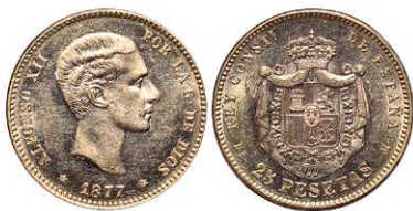
F 1471 25 PESETAS . 1877 *18-77 DEM. Cal-3. 8,1 grs. Parte del brillo original. EBC+. (Est. 260 €)..... 210 €