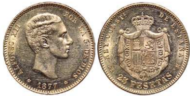
F 1468 25 PESETAS . 1877 *18-77 DEM. Cal-3. 8 grs. Parte del brillo original con golpes en la grafila. EBC. (Est. 260 €)..... 210 €