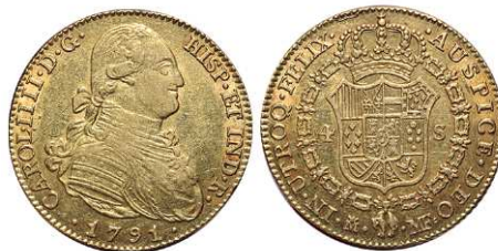
F 1412 4 ESCUDOS . 1791. Madrid M.F. Cal-201. 13,5grs. MBC+ . (Est. 700 €)..... 400 €