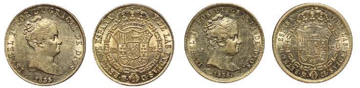
F 1444 80 REALES . 1835. Madrid C.R. Cal-68. 6,8grs. MBC-/EBC- (Est. 340 €)..... 200 €