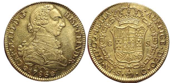
F 1403 8 ESCUDOS . 1786. Sevilla C. Cal-260. 27,1grs. Parte de brillo original. Escasa. EBC+ . (Est. 1800 €) .....1.200 €