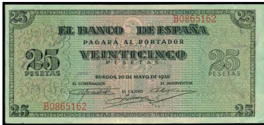
F 1567 25 PESETAS. 20 de Mayo de 1938. Serie B. E.D31a. EBC- . (Est. 150 €)..... 50 €