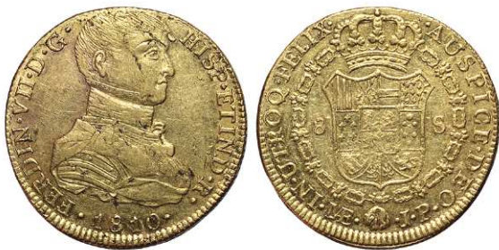
F 1423 8 ESCUDOS . 1810. Lima J.P. Cal-14. 26,9grs, Busto indigena. Hojas en anv. MBC+/EBC- . (Est. 1600 €) 850 €