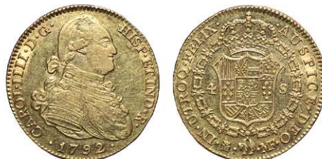
F 1413 4 ESCUDOS . 1792. Madrid M.F. Cal-202. 13,4grs. MBC+/EBC . (Est. 700 €)..... 400 €