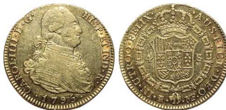
F 1415 4 ESCUDOS . 1795. Madrid M.F. Cal-204. 13,4grs. (Hoja en anv.) MBC+ . (Est. 700 €)..... 400 €