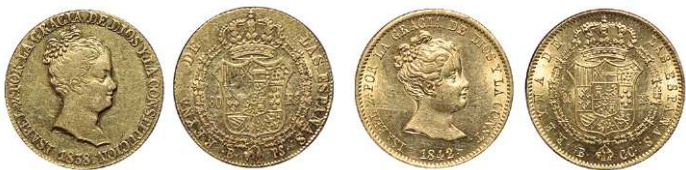
F 1436 80 REALES . 1838. Barcelona P.S. Cal-52. 6,7grs. Golpe en reverso. MBC- . (Est. 350 €)..... 230 €