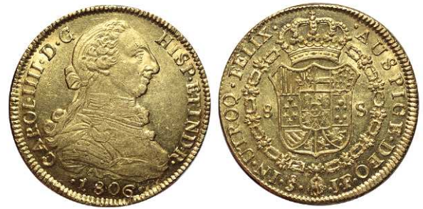
F 1399 8 ESCUDOS . 1806. Santiago JF. Cal-169. 27grs. Parte de brillo original. EBC . (Est. 1800 €).....1.200 €